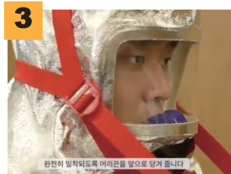
3 완전히 밀착되도록 머리끈을 앞으로 당겨 줍니다.