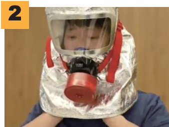
2 입구를 벌리고 목까지 내려착용합니다.