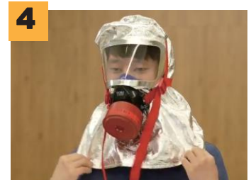
4 내부 면체의 위치를 얼굴에 맞게 조절합니다.